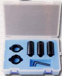
ホルダーパイプセット (シャンクφ12, φ16, φ20)

技術がいらず、だれでも使える だから簡単！ 差し込んで回すだけ だから早い！ コンパクトなボディで機能的 しかも安い！