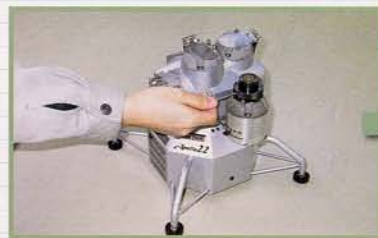
SET 専用ホルダーによる簡単セッティング